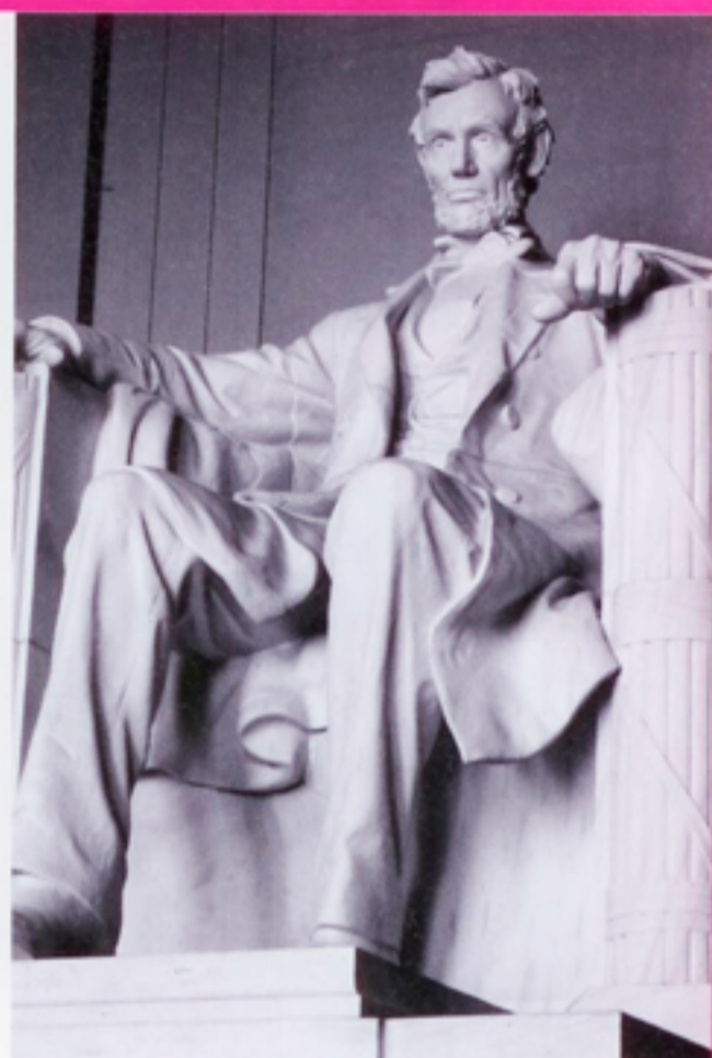
↑ Links: Jasper de Beijer, Zonder titel (uit de serie Cahutchu), 2006, 50 x 75 cm, Ed. 5, C-print; rechts: Lincoln Memorial, foto: Barb Ballard